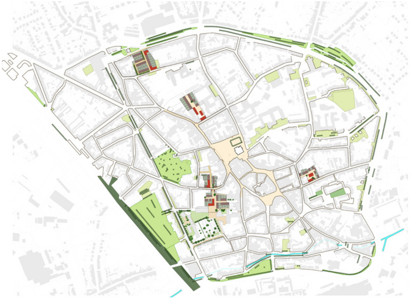
Ontwerpend onderzoek op bouwblokprojecten in de binnenstad